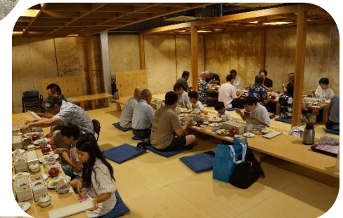
9月14日(日) 城山ホテルで夕食