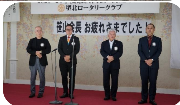
次年度会長、幹事、SAA、親睦委員長のご紹介